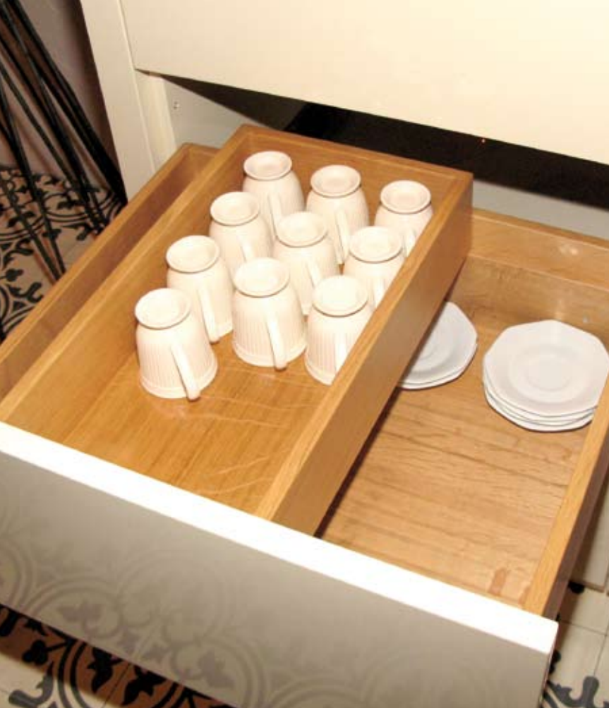
Zwiers gebruikt bij voorkeur massief hout, al is hier MDF toegepast vanwege het spuitwerk, waar geen houtnerf doorheen mag komen. Praktisch: verschuifbare bak zodat de lade efficiënter te vullen is.