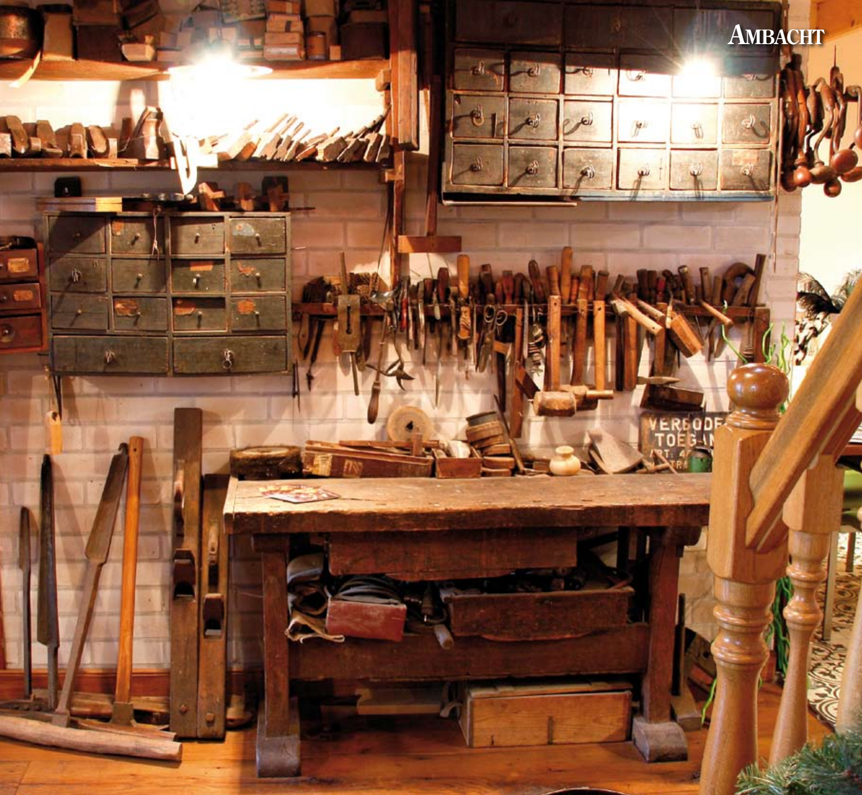
Begin vorige eeuw had de overgrootvader van Rudy Zwierts al een timmerkamer, een soort boerenaannemersbedrijf. Nu is er bij Meubelmakerij Zwierts een museumwerkplaats ingericht, met gereedschappen en machines uit vroeger tijden.

N ee, helemaal ononderbroken is de lijn niet', vertelt Rudy Zwierts. 'Rond 1900 was er bij het oudershuis van mijn opa een zogenoemde timmerkamer, zoals dat hier op het platteland heette. Dat was een soort allround boerenaannemersbedrijf. Alles wat je van hout kon maken, werd er gemaakt. En dan moet je niet alleen aan het gebruikelijke bouwvakkerswerk denken, maar ook aan meubels – die gingen vaak meerdere generaties mee – en boerenwagens. En of je wilde of niet, ooit werd je toch klant bij de timmerkamer, want je lijkst kwam er ook vandaan. Daar hadden ze nog een mooie spreuk voor, al was die niet zo geschikt voor begrafenissen: "Best gekist, minst gemist"... Mijn opa, Harm Zwierts, heeft de timmerkamer gelaten voor wat het was. Mijn vader heeft de draad weer opgepakt, het zat kennelijk