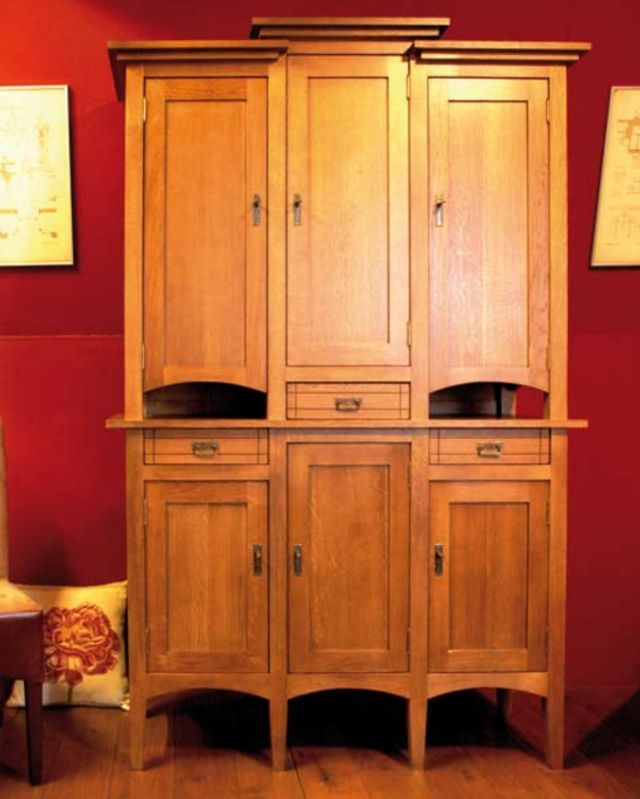
De stijl van deze kast is een eerbetoon aan de Schotse architect en ontwerper Charles Rennie Mackintosh. Kenmerkend zijn de nadruk op verticale lijnen en de vier op gelijke afstand geplaatste poten.