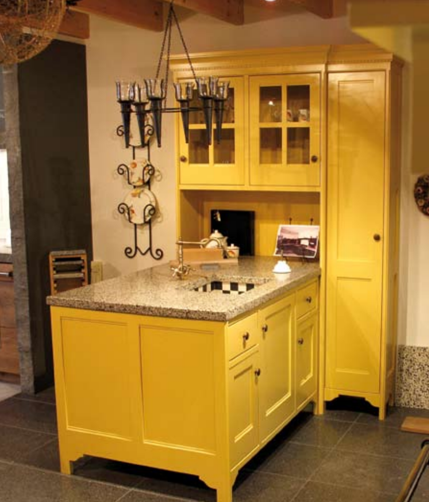
Moeilijke situaties, bijvoorbeeld een beperkte ruimte, leiden vaak tot zeer creatieve oplossingen: geen kookeiland maar een schiereiland. Zwiers maakt zowel klassieke als moderne keukens.