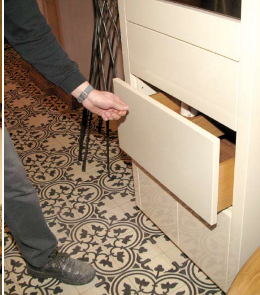
Een la die zachtjes openglijdt als je er tegenaan duwt. Decadente luxe? Welnee, gewoon handig, bovendien blijft het front glad omdat je geen greepjes nodig hebt.

richt; je bent er net door gekomen. Sommige dingen gebruiken we nog wel eens, er zit heel mooi spul bij waarmee je nog steeds prima kunt werken. Jammer genoeg zijn het gereedschap en de machines niet echt uit de timmerkamer van mijn overgrootvader, maar het zijn wel dingen die er gestaan zouden kunnen hebben, alles is tijdsorigineel.'